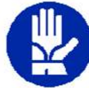
Guanti di protezione obbligatori