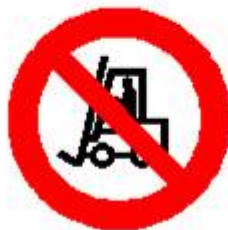
Vietato ai carrelli di movimentazione