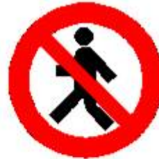
Vietato ai pedoni