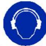
Protezione obbligatoria dell'udito