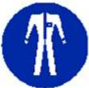
Protezione obbligatoria del corpo