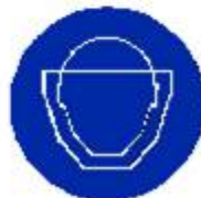
Protezione obbligatoria del viso