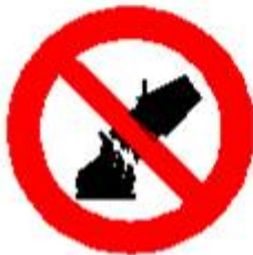
Divieto di spegnere con acqua