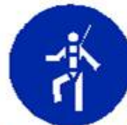
Protezione individuale obbligatoria contro le cadute dall'alto