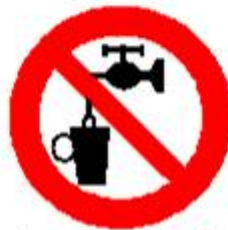
Acqua non potabile