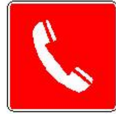
Telefono per interventi antincendio