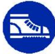
Calzature di sicurezza obbligatorie