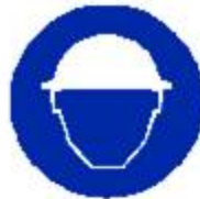
Casco di protezione obbligatorio