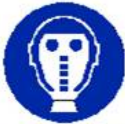
Protezione obbligatoria delle vie respiratorie