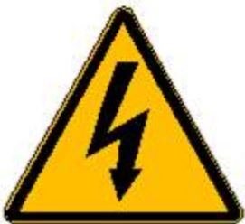
Tensione elettrica pericolosa