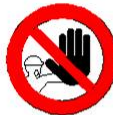
Divieto di accesso alle persone non autorizzate