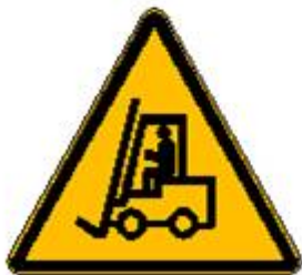
Carrelli di movimentazione