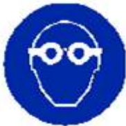
Protezione obbligatoria degli occhi