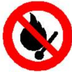
Vietato fumare o usare fiamme libere