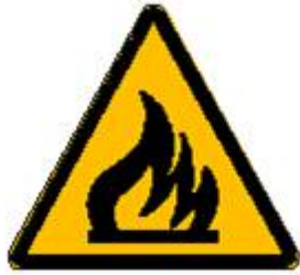
Materiale infiammabile o alta temperatura